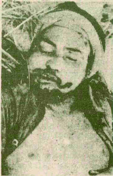
El cadáver de uno de los alzados muestra un impacto de bala en el rostro.

Un escueto boletín informativo de las FFAA de Honduras dió cuenta de un combate entre soldados del IV Batallón de Infantería y un grupo de supuestos guerrilleros en el norteño departamento de Atlántida. De acuerdo a la información, en el choque armado perecieron dos guerrilleros y un soldado del ejército. Las fotografías de los insurgentes muertos